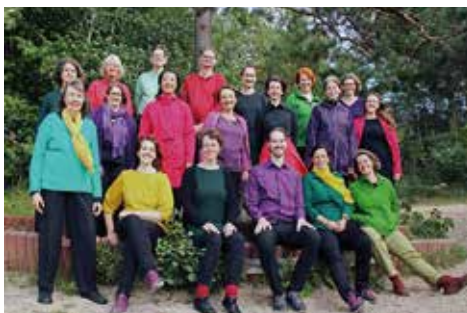
Der „Celtic Choir“

Den Spuren einer mythischen Sagengestalt folgend, werden die Lieder miteinander verwoben und in einen neuen Kontext gesetzt. Der Eintritt ist frei.