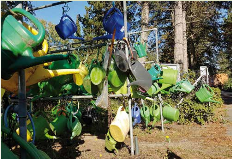
Gießkannen am Eingang vom Martin Luther Friedhof Reinickendorf