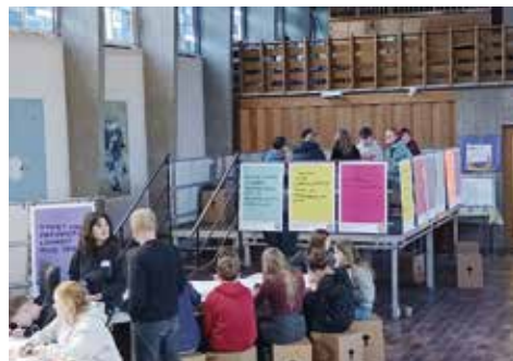
Für die KonfirmandInnen waren die praktischen Angebote am interessantesten – die Älteren aus den „Jungen Gemeinden“ diskutierten lieber auf den „Podiums-Inseln“