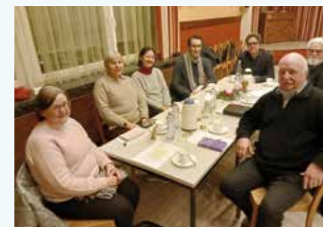
Im Gemeindehaus St. Sebastian in der Feldstraße 19 (Bus 247 Gartenplatz, S Nordbahnhof, M 10 Mauergedenkstätte) finden die ökumenischen Bibelgespräche statt.

Die weiteren Themen und Termine werden bei den Treffen verabredet. Die Ökumenischen Bibelgespräche sind eine gemeinsame Veranstaltung der katholischen