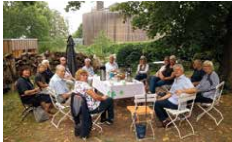
Monatliches Hütertreffen im NiemandsLand

Seit zehn Jahren gibt es Kapellenhüterinnen und -hüter an der Kapelle der Versöhnung. Wir wollen dieses Ehrenamt und seine Mitwirkenden vorstellen, werden zusammen danken für das, was war; Segen erbitten für alles, was kommen wird, und alle segnen, die diese Aufgabe übernommen haben. Ein