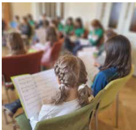
Probenstag 2023 mit Singfischen und Chorwurm in Pankow

gemeinsamen Probenstag mit dem Chorwurm in Pankow (siehe Foto), das Sommermusical „Die Reise nach Jerusalem“ und das Krippenspiel an Heiligabend in der St. Paul-Kirche.