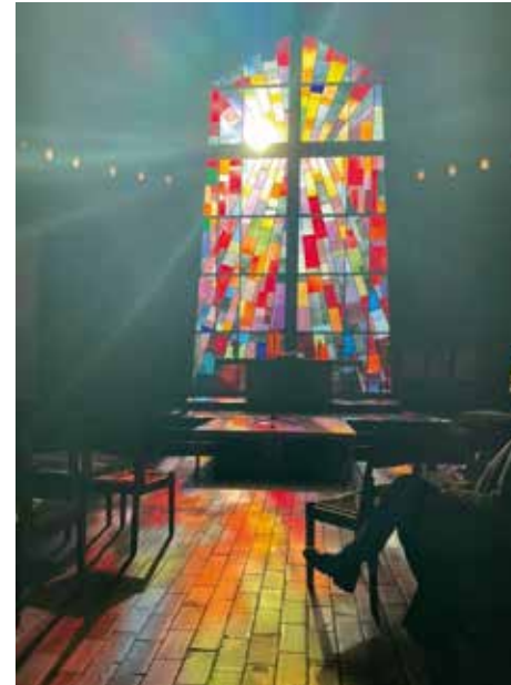
Das Altarfenster der Himmelfahrtskirche an einem sonnigen Sonntagmorgen