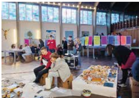
Gar nicht so einfach, kurz und knapp zu beantworten, „was zählt“ – und das dann noch zu „stempeln“.

Am 24. Februar kamen zur diesjährigen Jugend-Werkkirche zwischen 9 und 18 Uhr ca. 180 Jugendliche (in zwei „Durchgängen“) aus unserem Kirchenkreis zusammen, um sich der Frage nach dem eigenen Lebensentwurf zu stellen – und sich für die Unterschiedlichkeit von Lebensentwürfen zu sensibilisieren, um zu entdecken: Zusammen leben gelingt besser, wenn Menschen mehr voneinander wissen – und einen Einblick in die Geschichte