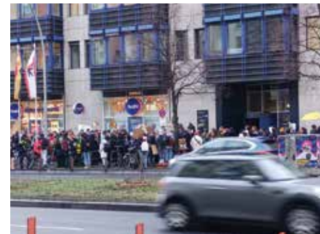
Am 23.01.2024 demonstrierten vor allem Mitarbeitende der Jugend-Einrichtungen des Bezirkes anlässlich einer Senatssitzung im Rathaus Friedrichshain

Vermutlich war längst noch nicht allen politisch Verantwortlichen bewusst, welche Konsequenzen mit dieser Art von „Spar-Vor-